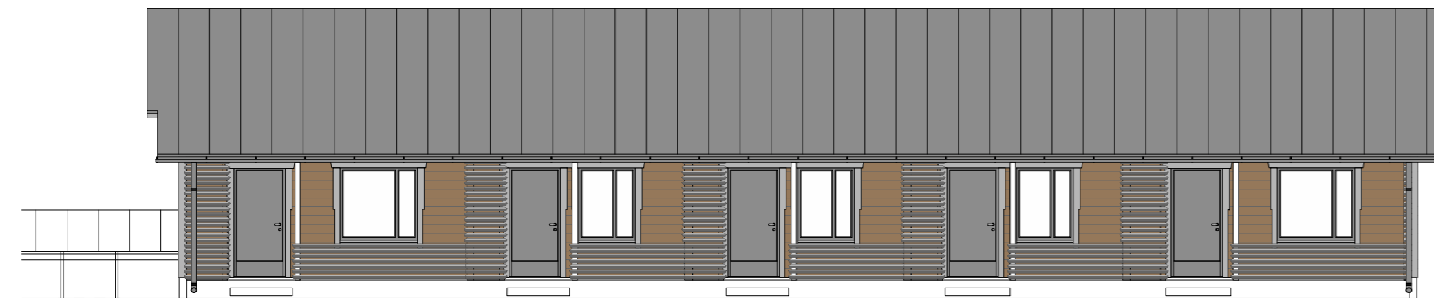
TALO B, JULKISIVU LÄNTEEN